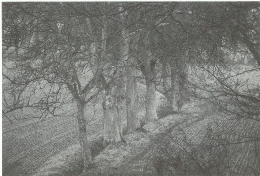
Le nant sans nom