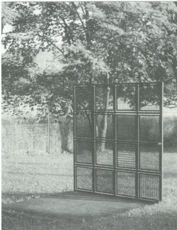
L'espace ressassé ou le champ éprouvé de Marie Gagnot